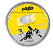
Express Racing Paste