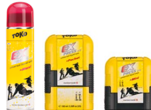
Express Maxi Express Pocket Express Mini