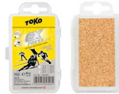
Express Racing Rub-on