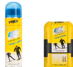
Express Grip & Glide Express Grip & Glide Pocket